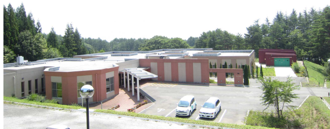
第二仁生園の外観写真 平成23年7月撮影