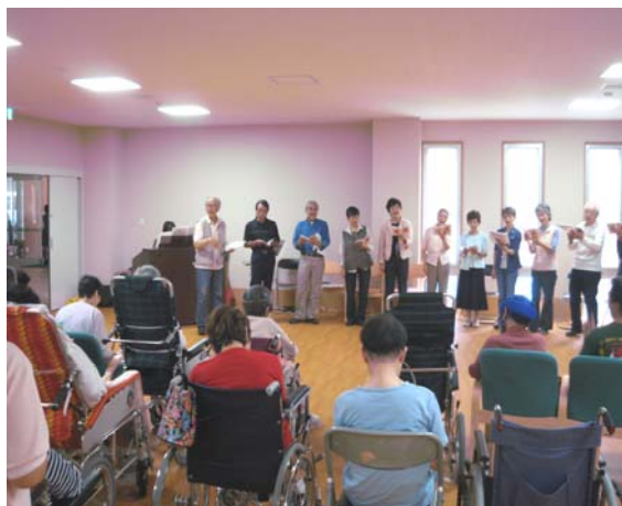
【 コーラスにより一体感に包まれました 】

ご登録いただいた緊急連絡先または介護・医療保険証等に変更・更新がある場合には、ご利用のサービス担当者までご連絡のうえご提出ください。