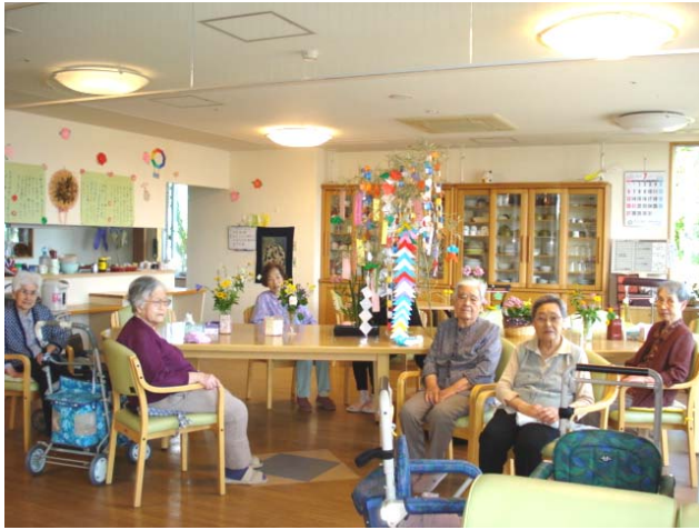
【 願いが叶いますように 】