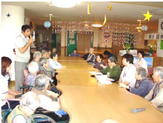
【 活発な意見が飛び交いました 】

七月九日(水)、四階フロアにて「入所者のつどい」が行なわれました。 参加された入所者のみな様から、日頃の行事や食事・入浴に関する希望などの意見が出されました。 衣料ショッピングに関しては、「自分で服を選び買うことができ満足している」「安く購入できた」などの意見が数多く出されました。 また、毎月行なわれます誕生会に関しては、「ごちそうが多すぎて捨てる量が多すぎたいない」「煮物など昔なつかしいものを食べたい」など今後検討すべき意見が出されました。 みな様の貴重な意見をお聞きすることができ、たいへん有意義な時間になりました。