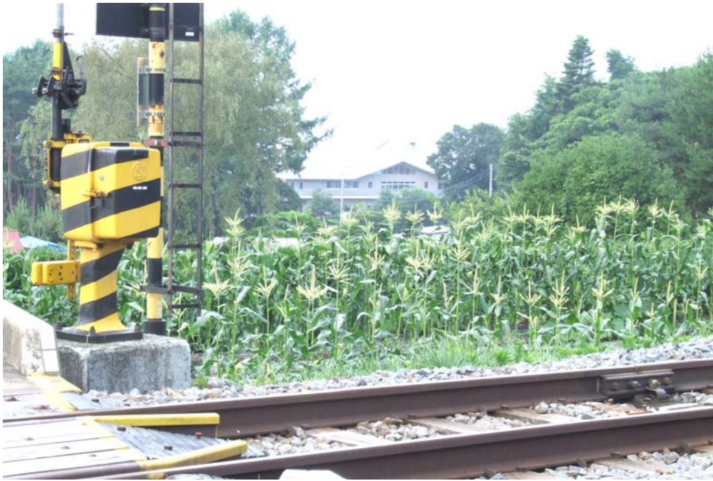
【 小海線から見える仁生園 】