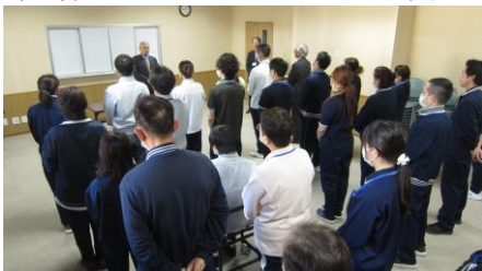
【 平成 30 年新年互礼会の様子 】