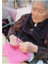
編み物もお手の物! お見事!

また、一人ひとりの趣味や特技が生かせるような、余暇活動を提供して支援させていただきます。