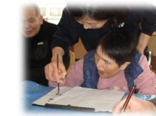
皆さんの力作が勢ぞろいです!!