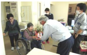
利用者の皆様が事務所にも届けてくださいました!