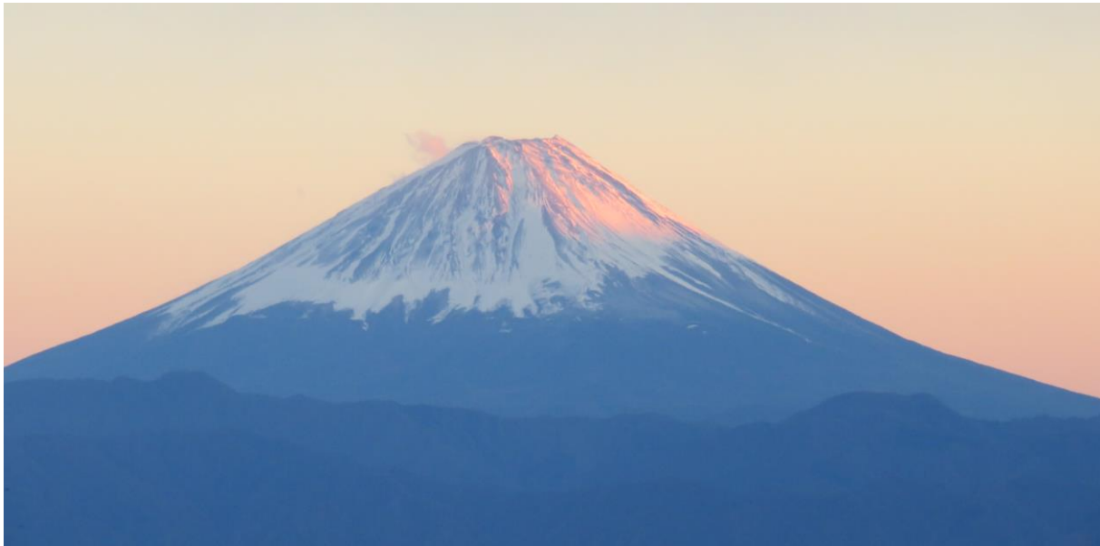
【 小荒間「富士見坂」から望む富士山 】