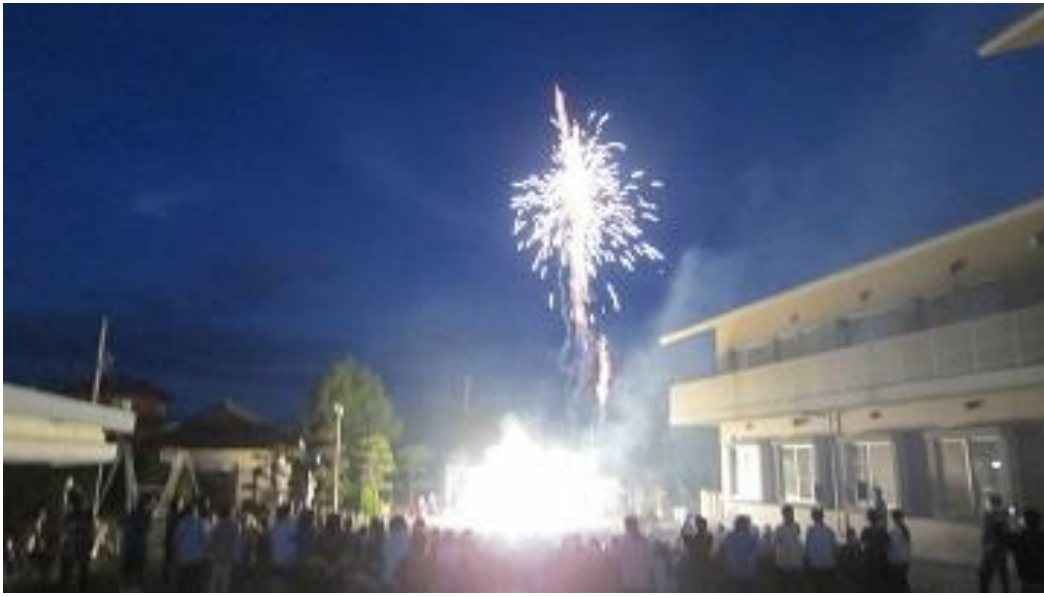
【 夏の夜空に花開く ～ 仁生園 花火大会の様子 ～ 】