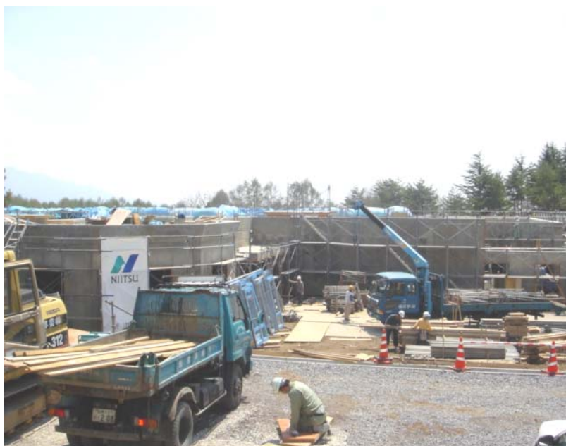
【第二仁生園建設 工事現場の様子】