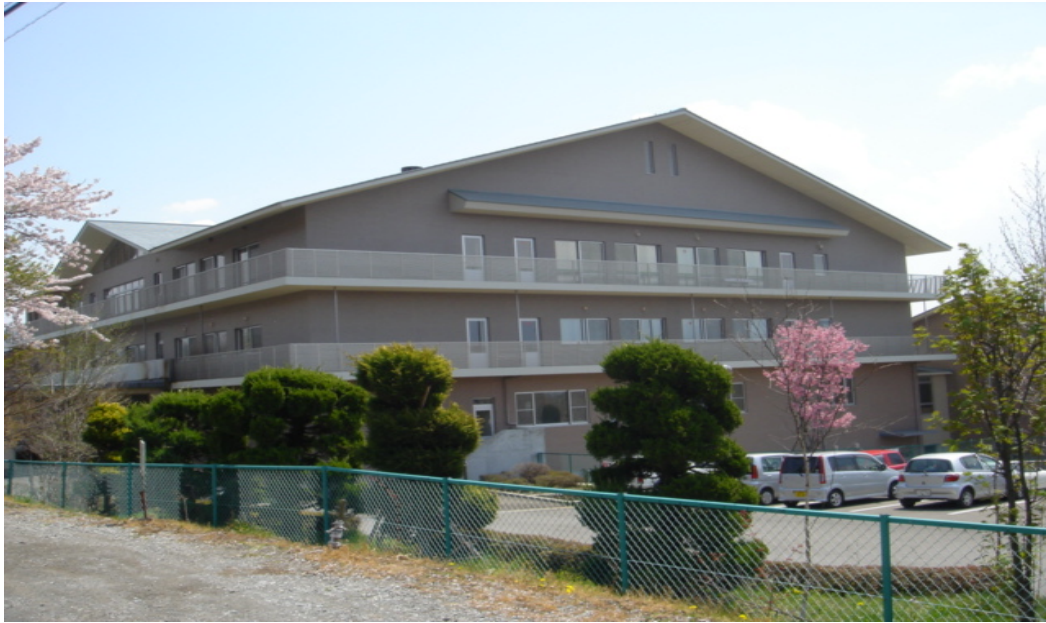
【桜満開の正面玄関】