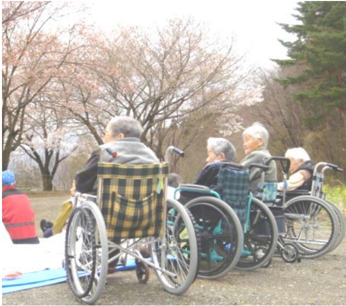
【お花見ハイクの一コマ】

長坂町小荒間にも、桜の美しい季節がやってきました。四月十九日、二十日、二十三日と毎年恒例のお花見バスハイキングが催されました。どのコースも桜が満開で、参加されたみな様に大変喜んでいただくことができました。